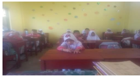
Gambar 4.4 Siswa mendengarkan guru menjelaskan didepan kelas.

Dan pada siklus ini peneliti ingin mengembangkan ide kreatif dalam menggambar siluet kepada siswa agar siswa mampu mengombinasi berbagai bentuk dan objek dalam satu gambar serta mampu menunjukkan peningkatan kerapian dan kreativitas dari siklus 1. Diharapkan siswa mampu menjelaskan makna atau cerita dari gambar yang dibuat