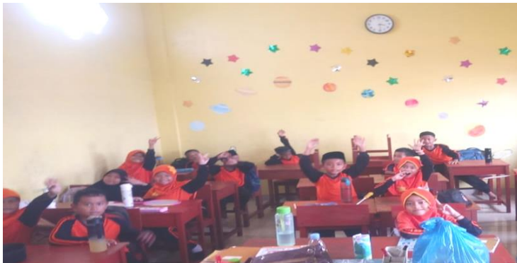
Gambar 4.2 Seluruh siswa antusia saat mendengarkan penjelasan dari guru.

memperhatikan materi yang telah dipaparkan oleh guru didepan kelas dan mereka tertarik untuk segera membuat gambar siluet. Kemudian, guru mengajukan pertanyaan kepada siswa, anak-anak tahukah kalian bagaimana cara membuat gambar siluet? Siswa menjawab serempak dengan jawaban tidak tahu. Selanjutnya guru memberitahukan kepada siswa tentang materi yang akan dipelajari pada pertemuan ini yaitu teknik menggambar siluet. Setelah pengenalan materi selesai, siswa ditugaskan mengerjakan lembar kerja untuk mewarnai lukisan siluet yang telah dipersiapkan oleh guru untuk memancing minat dan kreatifitas dari seluruh siswa.