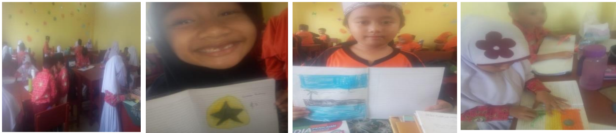
Gambar 4.5 Siswa menggambar dengan teknik siluet

papan tulis. Setelah guru memberikan contohnya di papan tulis, guru memerintahkan anak-anak untuk mengikuti langkah –langkah menggambar kemudian langkah selanjutnya anak –anak mewarnai gambar tersebut dengan warna hitam. Unikny dari penelitian ini, hampir semua anak menggambar dengan bentuk yang lucu tidak seperti bentuk aslinya, Hanya beberapa anak saja yang menggambar dengan hasil sesuai aslinya. Pada saat anak melakukan kegiatan, peneliti bersama kolabolator mengamati dan mencatat perkembangan anak. Selain itu peneliti juga memotivasi, member pujian pada anak dalam melakukan kegiatan menggambar ini.