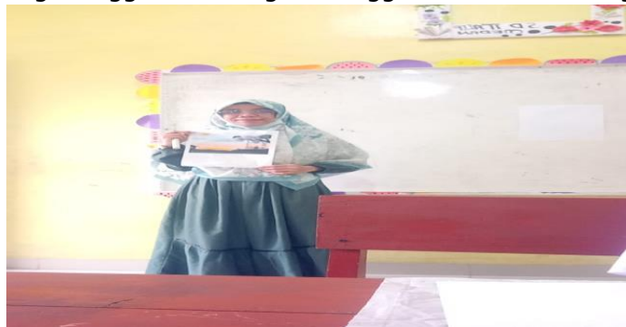
Gambar 4.1 Guru memberi informasi tentang menggambar dengan menggunakan teknik siluet.

Guru membuka pembelajaran dengan mengucapkan salam dan memperkenalkan diri, lalu mengabsen siswa untuk mengetahui kehadiran siswa pada pembelajaran seni budaya dan keterampilan. Kegiatan awal dimulai dengan mengkondisikan siswa terlebih dahulu. Dimulai dengan merapikan tempat duduk, memeriksa kelengkapan belajar, kebersihan kelas dan mengecek kehadiran siswa. Setelah siswa dikondisikan selanjutnya guru melakukan tanya jawab dengan siswa untuk memancing pengetahuan awal siswa mengenai materi pembelajaran yang akan dipelajari. Setelah Tanya jawab, guru memberikan motivasi kepada siswa dengan berdialog memberikan informasi tentang menggambar dengan menggunakan teknik menggambar siluet.