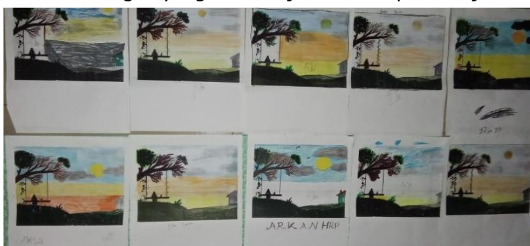
Gambar 4.3 Hasil mewarnai lukisan siluet siswa kelas 2 SD

Diakhir kegiatan pembelajaran, guru dan siswa mengadakan tanya jawab tentang kegiatan hari ini dan guru bertanya tentang suasana hati mereka , apakah mereka senang atau tidak mengikuti kegiatan menggambar pada hari ini. Guru dan siswa juga berdialog guna merumuskan dan merangkum pembelajaran pada hari ini . Guru juga menginformasikan alat dan bahan apa saja yang harus dipersiapkan untuk praktik menggambar dengan teknik siluet pada pertemuan berikutnya. Kemudian guru bersama siswa melakukan refleksi kegiatan pembelajaran hari ini yang bertujuan untuk memperbaiki kekurangan yang telah terjadi selama pembelajaran berlangsung.